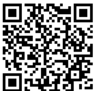
第二浜田ダム 水防情報QRコード