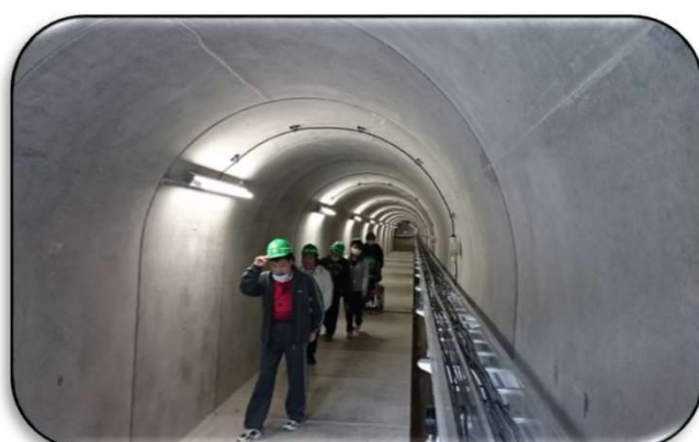
ダム内部（監査廊）見学