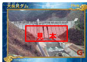
※萩・石見空港限定ダムカード