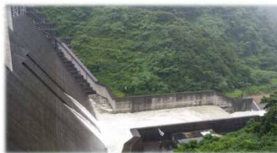
※H30年7月7日撮影 (常用洪水吐きの様子)

H30年度も西日本各地で大雨が降り、大きな被害をもたらしました。写真はH30年7月7日に撮影したものであり、 常用洪水吐き(2ヶ所の穴) から激しく水が流れている様子が分かります。紅葉湖も水が濁っており、上流から流木が流れてきました。