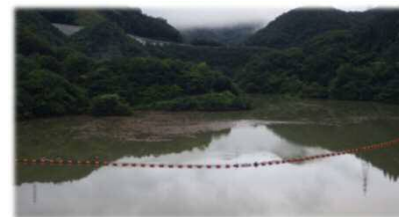
※H30年7月7日撮影 (紅葉湖の様子)