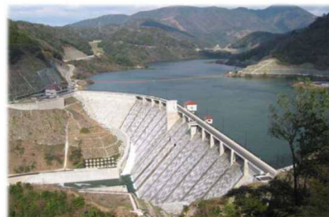
※非常用洪水吐から越流する様子 (H15試験湛水時の写真です)

また上空で厚い雲が急激に発達したり、あるいは雷が頻繁に鳴り始めた時などは局所的に突然大雨が降り出すことも少なくありません。上空で黒い雲が発生したり、雷が鳴ったりしたら河川の増水に注意しましょう。