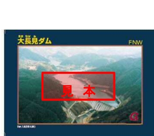
※通常のダムカード