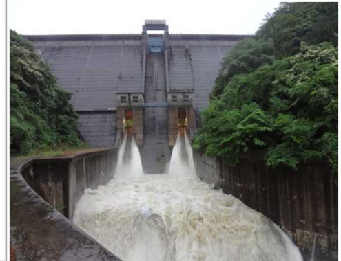
6月19日(水)18:45頃の放流の様子 放流量:39.34m³/s

6月18日から21日にかけて中国地方に梅雨前線が停滞し大雨となりました。浜田ダムでは洪水期(～9月30日)の貯水位が126.0mを超えないよう管理するためにダムの水を放流しました。