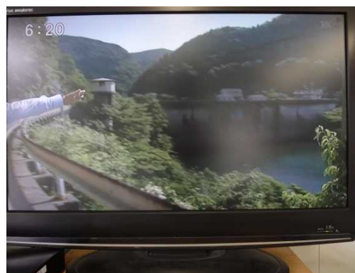
6月7日(金) 夕方 山陰中央テレビにて放映