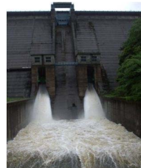
5月12日 9:00頃放流の様子 放流量: 18.23m³/s