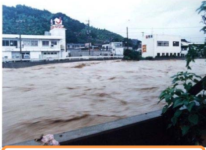
浜田川-浅井川 合流点