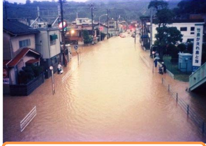
合庁前バス停付近