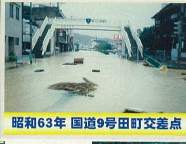
昭和63年 国道9号田町交差点