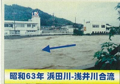
昭和63年 浜田川-浅井川合流