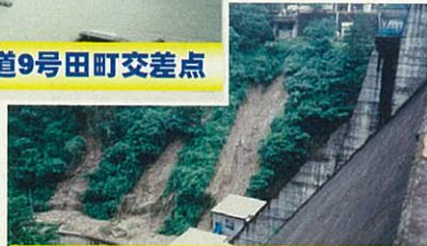
昭和63年 浜田ダムの様子

毎年6月16日から9月30日までの期間は、大雨が降る可能性が高い洪水期です。 近年は時間雨量が20mmを越えるような激しい雨が多くの場所で記録されていますので、大雨に注意してください。