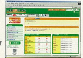
防災ポータルのページ

ポータルページにある左のボタンを選択し、画面の説明に従って登録作業を行うと選んだ情報がメールで送られてきます。