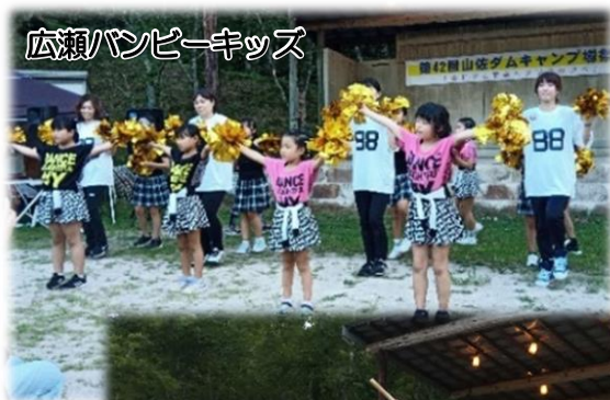
広瀬バンビーキッズ

今年度の「山佐ダムキャンプ場まつり」のメインテーマは『音楽とダンス』。安来市のJr.ブルスバンドや地元のダンスチームによる、会場が一体となるような、楽しく元気な演目が披露されました。また、式典では、山佐ダムキャンプ場への屋外放送設備の寄贈に対する感謝状の贈呈や、山佐ダム建設以前の風景絵画の寄贈が行われました。