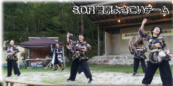
S.D.R. 菅原よさこいチーム