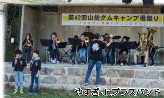
やすぎ Jr.ブルスバンド

新型コロナウイルス感染症の影響により、3年ぶりの開催となった昨年度に続き、今年度は200人規模で行われた山佐ダムキャンプ場祭りも、今年で42回目です。キャンプブームもあり、利用客の増えている山佐ダムキャンプ場のますますの発展と、来年以降のお祭りがより盛り上がり上げていくことを願っています。