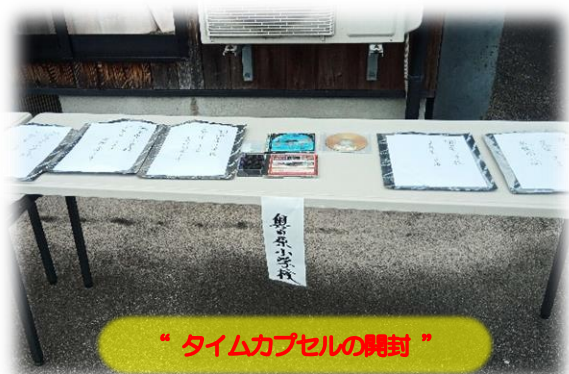
“タイムカプセルの開封”

7月30日（土）に開催されました「第41回山佐ダムキャンプ場まつり」に行ってきました。昨年、一昨年は新型コロナウイルス感染症の感染拡大により開催を中止しましたが、今年度は3年ぶりの開催となりました。