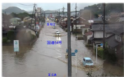
写真① 国道54号冠水状況