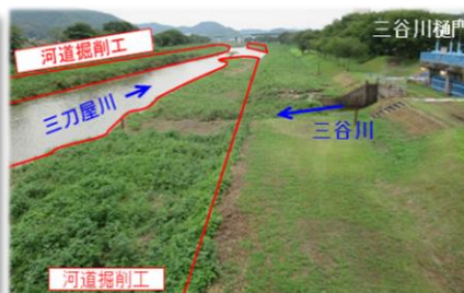
写真③ 三刀屋川掘削範囲