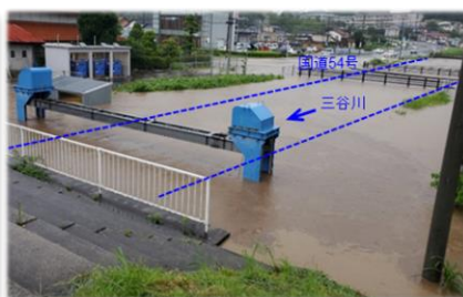
写真② 三谷川周辺浸水状況