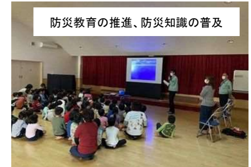
防災教育の推進、防災知識の普及