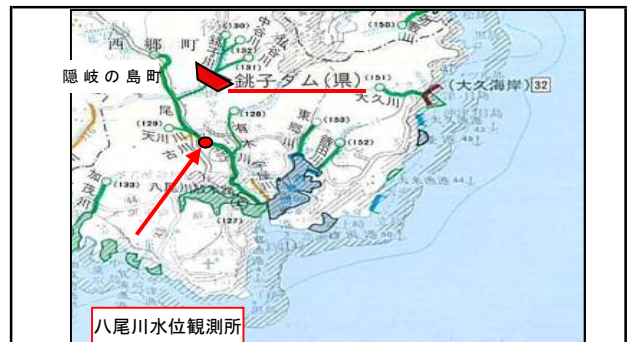
所在地: 島根県隠岐郡隠岐の島町原田