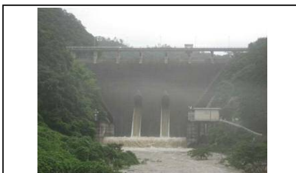
所在地:島根県浜田市三隅町 ※写真はイメージです。