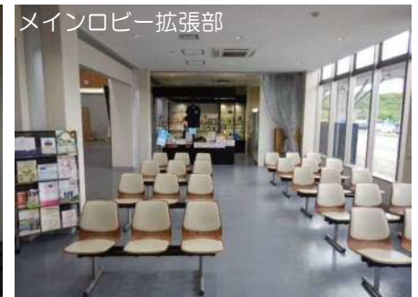
メインロビー拡張部