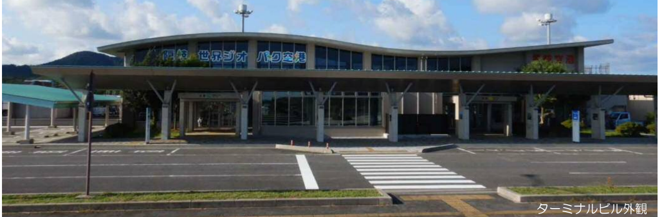
ターミナルビル外観