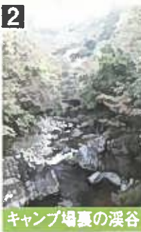
キャンプ場裏の溪谷

裏匹見峡の入口にある施設で食事も可能。コテージやキャンプ場を完備しており、アウトドアの拠点として絶好のスポット。毎週水曜日と12月～2月の冬期は休館日。TEL0856-56-0341