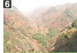
裏匹見峡展望台の眺望