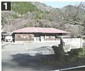
匹見峡レストパーク

裏匹見峡の入口にある施設で食事も可能。コテージやキャンプ場を完備しており、アウトドアの拠点として絶好のスポット。毎週水曜日と12月～2月の冬期は休館日。TEL0856-56-0341