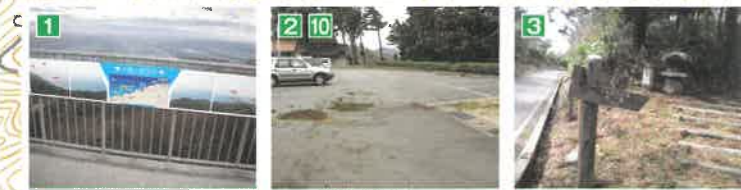
1 大麻山山頂 車道がついているので山頂まで車で上がることも可能。山頂にはテレビ塔が建ち並び、展望台からは日本海の美しい海岸線が見える。 2 10 大麻山駐車場 山頂へは、石段を上り、大麻山神社の右側を通る道を登る。室谷方面へは公園下の歩道を通って林道へ出る。枯山水の庭園が隣接している。(周遊モデルコースの終点) 3 歩道・林道分岐点 大麻山公園からの歩道と林道大麻山線との分岐点。ここから室谷の集落までは下り道が続く。