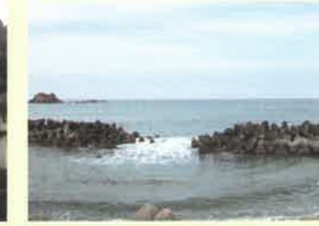
折居海岸 浜田市の西端、三隅町と境を接するおよそ1kmの砂丘海岸。山陰本線折居駅のすぐ前が海岸線となり、国道9号も山陰本線と並行しているため交通の便がよく、海水浴場として賑わう。