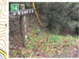
14 車道・歩道交差点 下る場合、建物の横で右折。(写真は下り方向)