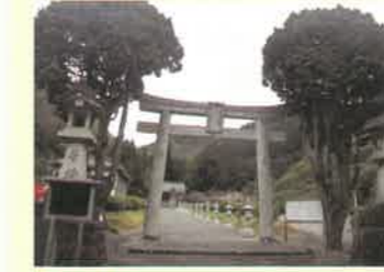
三隅神社 祭神は三隅氏四代目三隅兼連。昭和12年に造営された。境内には三隅公園や浜田市三隅歴史民俗資料館がある。三隅公園には約5万本のツツジがあり、石見随一ともいわれている。