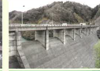
御部ダム 三隅川に設置されている。平成2年完成。ダム湖は、みやび湖と名づけられている。