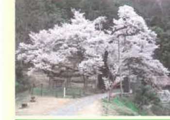
三隅大平橋 存在感のある太い幹の周囲から5.4m、高さ17m、枝の広がり27mに及ぶ。白い桜花が開いたときの光景は、まさに雪の小山のよう。