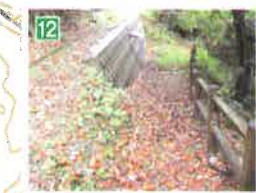
12 ヘアピンカーブ。木柵が目印。