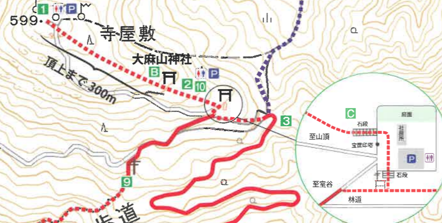
大麻山(たいまさん) 浜田市と三隅町境にそびえる標高599mの山。海岸に近い独立山なので頂上からの眺望がすばらしく、山頂には高さ10mの展望台がある。