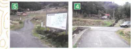
5 上室谷集会所先(農道・農道分岐点) 棚田の風景が美しい。 4 農道・林道分岐点 大麻山神社から下りてきた林道(写真右方向)から、橋を渡り農道へ入る。(写真左方向)