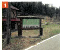
小松地(車道・歩道分岐点)

県道横に大型案内板(地図)あり。やなしお道の西の起点で、民家横の橋を渡って山道へ入る。