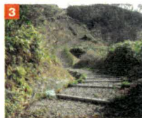
邑智北ふるさと農道(立体交差)

竹林が美しい。かつて、十王と六観音を安置した小堂が建っていた。ここで道が直角に折れる。東側(湯抱・粕洲方面)200m先に、三瓶山の眺望がよい「茶繰原(ちゃえんばら)」がある。