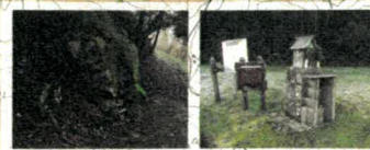
梅雨(ちゅう)左衛門 萩原(おぎわら)千軒 大者の洞(ほこら)には、白い大蛇が祀られている。江戸時代には銀山街道の宿場として大繁盛した。