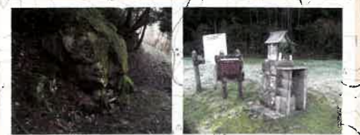
梅雨(ちゅう)左衛門 萩原(おぎわら)千軒 大岩の祠(ほごら)には、白い大蛇が祀られている。江戸時代には銀山街道の宿場として大繁盛した。