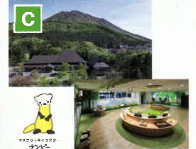
島根県立三瓶自然館サヒメル