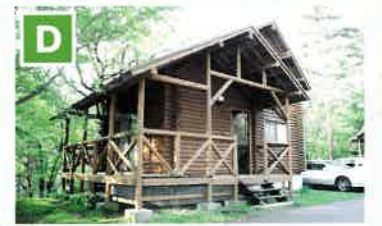
北の原キャンプ場 三瓶の自然を満喫できるキャンプ場。テントサイトの他に冷暖房完備のケビンやベトナム宿泊出来るドッグバンガローなども備え、個人から団体まで楽しむことができる。