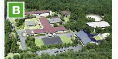
国立三瓶青少年交流の家 三瓶山北の原に位置し、自然体験や集団宿泊体験などの体験活動や研修活動を通して、青少年の健全育成を図ることを目的とした国立青少年教育施設。