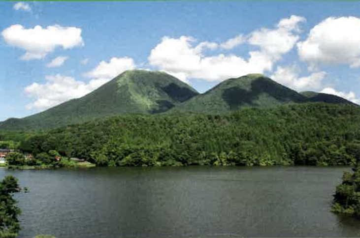
コースの概要 浮布池と三瓶山

中国自然歩道 三瓶山麓コース 三瓶山(さんべさん)は、西・東・北にそれぞれ広大な草原をもったトロイデ型火山で、国立公園に指定されています。優美な裾野のうえには、男(お)三瓶山・女(め)三瓶山・子(こ)三瓶山・孫(まご)三瓶山などの峰々が環状に連なり、その内側に室の内(むろのうち)と呼ばれる火口があります。 北の原・西の原モデルコース 三瓶山北の原から西の原草原へ続くコースで、三瓶山北斜面自然林を通過して姫逃池に至る2.5kmの区間は、「自然観察モデルコース」に指定されています。 西の原・湯抱モデルコース 三瓶山西の原から浮布池を通過し、山を越えて湯抱温泉へ至るコースです。