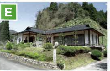
齋藤茂吉鴨山記念館 美郷町湯抱にある鴨山を柿本人麻呂の終焉の地と定めた歌人・齋藤茂吉の研究の遺墨・遺品・写真・書物を展示。「人鷹が つひのいのちををはりたる 鴨山をしも 此処と定めむ」と刻まれた歌碑が建立されている。