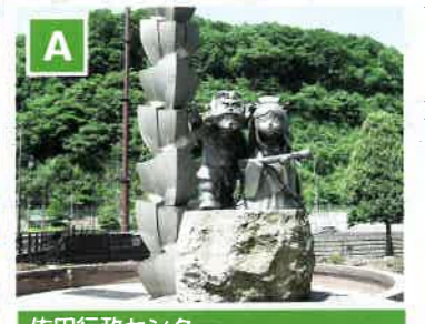
佐田行政センター コースのスタート地点。