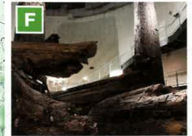
三瓶小原埋没林公園「さんべ縄文の森ミュージアム」 (国指定の天然記念物 令和2年6月日本遺産認定) 約4千年前の縄文時代後期の頃、太古の森の巨木群を三瓶山の火山活動による火砕流や土石流が飲み込み、巨木の森は地底に埋没した。長い年月を経た今、私たちはその地底の森を発掘されたままの姿で見たり、触れたりすることが出来る。展示されている根株は、顔を近づけると杉の香りが残っていることが分かる。縄文時代への時間旅行で太古のパワーを感じてみよう。