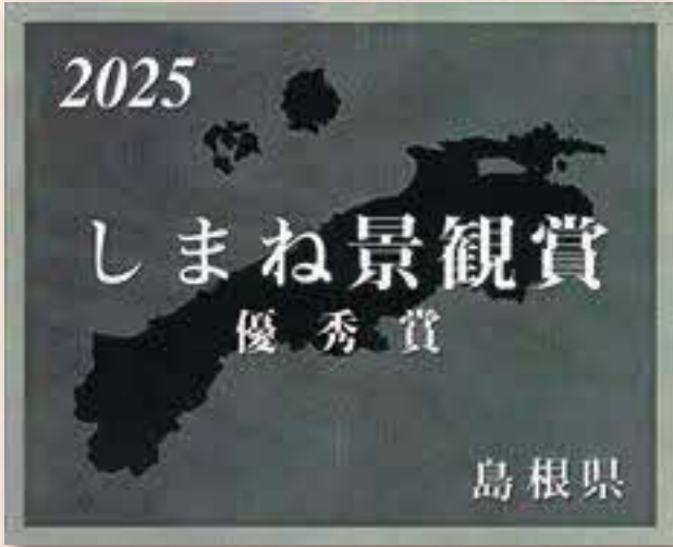
しまね景観賞表彰銘板