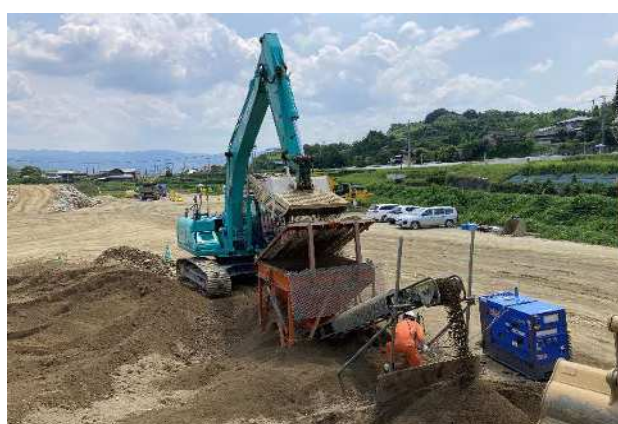
災害発生土による吹付用土砂製造