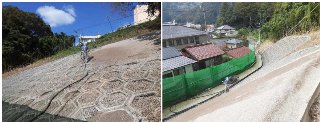
【法面整形後 防草土吹付作業】