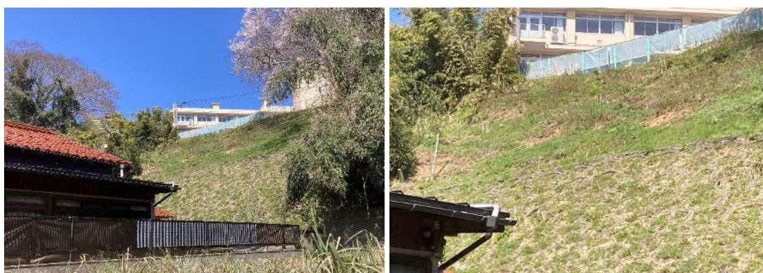
【施工前全景 急傾斜地崩壊危険区域】