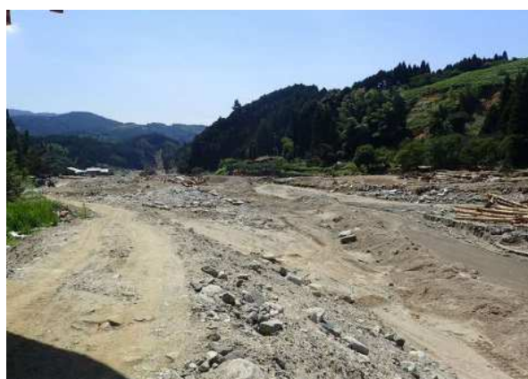
平成29年 九州北部豪雨により被災