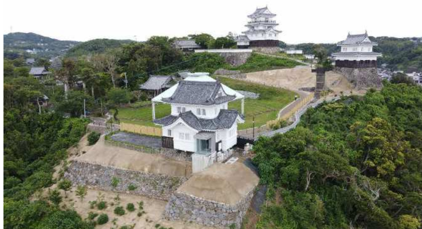
【平戸城 遠景 R4・R5施工】