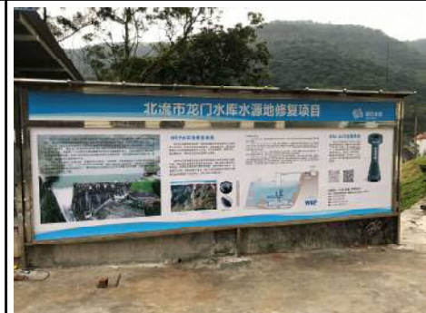
アンカー方式 場所: 龍門ダム (中国・北流市) H30.12月設置