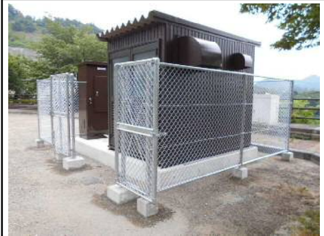
アンカー方式 場所: 三瓶ダム (島根県) H29. 8月設置