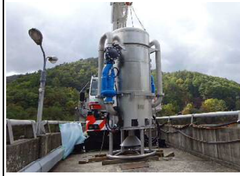
アンカー方式 場所: 樽床ダム (広島県) H29. 2月設置