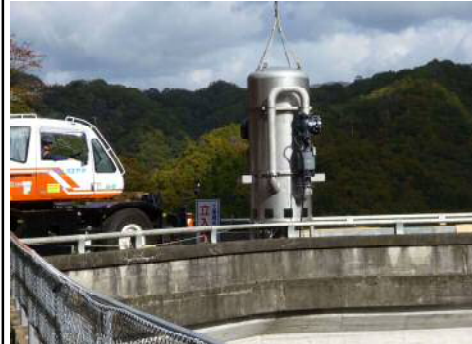
アンカー方式 場所: 来島ダム (島根県) H28. 3月設置