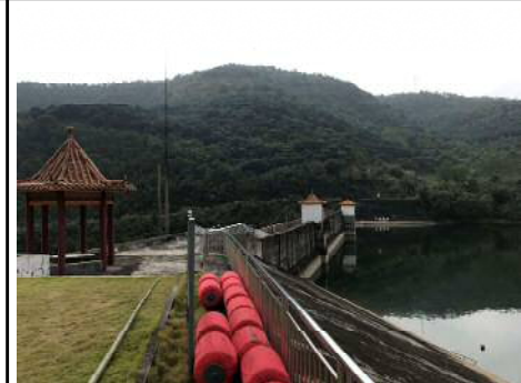
アンカー方式 場所: 龍門ダム (中国・北流市) H30.12月設置