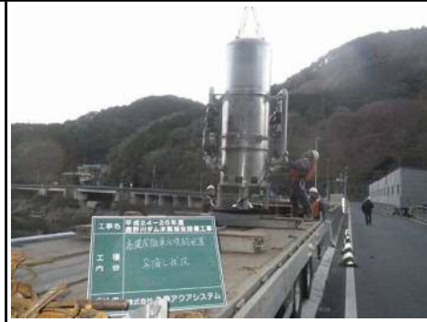
アンカー方式 場所: 鹿野川ダム (愛媛県) H26. 2月設置