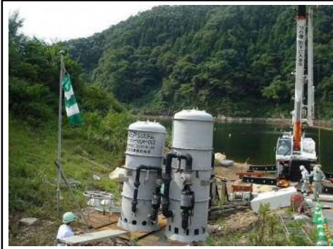
アンカー方式 場所: 灰塚ダム (広島県) H22. 12月設置