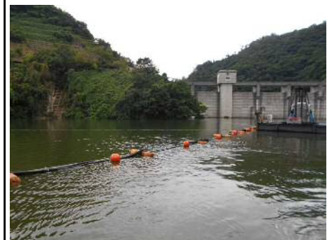
アンカー方式 場所: 三瓶ダム (島根県) H29. 8月設置