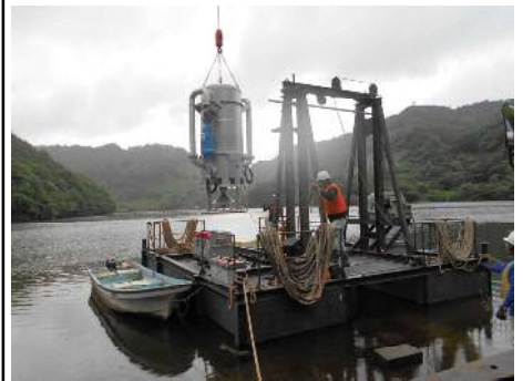
アンカー方式 場所: 三瓶ダム (島根県) H29. 8月設置