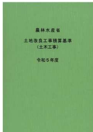
[別冊] 建設工事積算基準 農業農村整備編 【PDF配布】