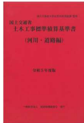
[別冊] 建設工事積算基準 河川編、道路編 【PDF配布】