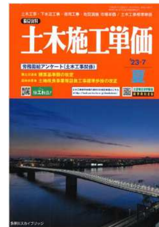
建設物価調査会発刊