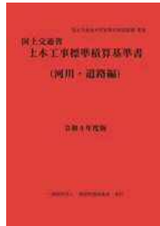
[別冊] 建設工事積算基準 河川編、道路編 【PDF配布】