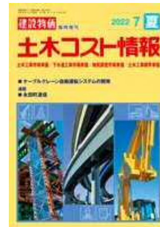
建設物価調査会発刊