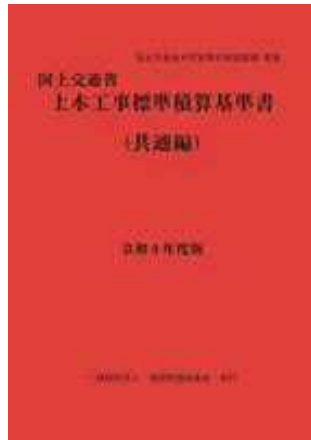
[別冊] 建設工事積算基準 共通編 【PDF配布】