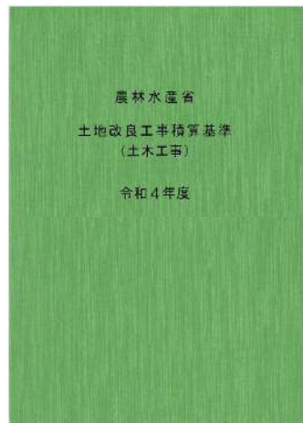
[別冊] 建設工事積算基準 農業農村整備編 【PDF配布】