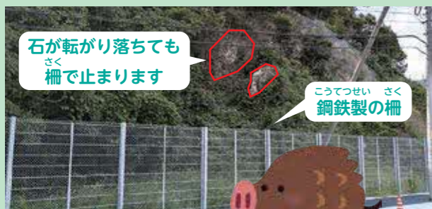
石が転がり落ちて さく 柵で止まります