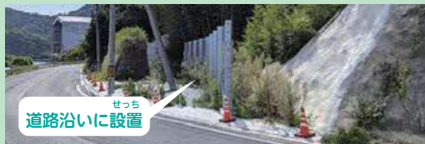
せっち 道路沿いに設置

山から石などが転がり落ちて道路に出ないように こうてつせい さく せっち 鋼鉄製の柵を設置しています