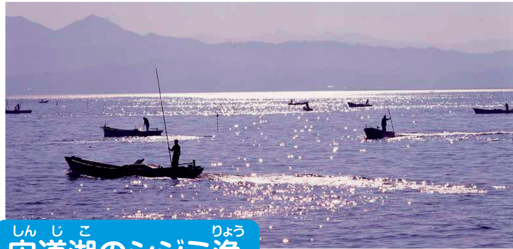
宍道湖のシジミ漁

宍道湖・中海は水鳥がやってくる湖として有名ですが、朝のシジミ漁のようす、夕暮れ時の風景、夜景などもすてきな場所です。時間や天気、季節によって変化する美しさを、足をとめてながめませんか。