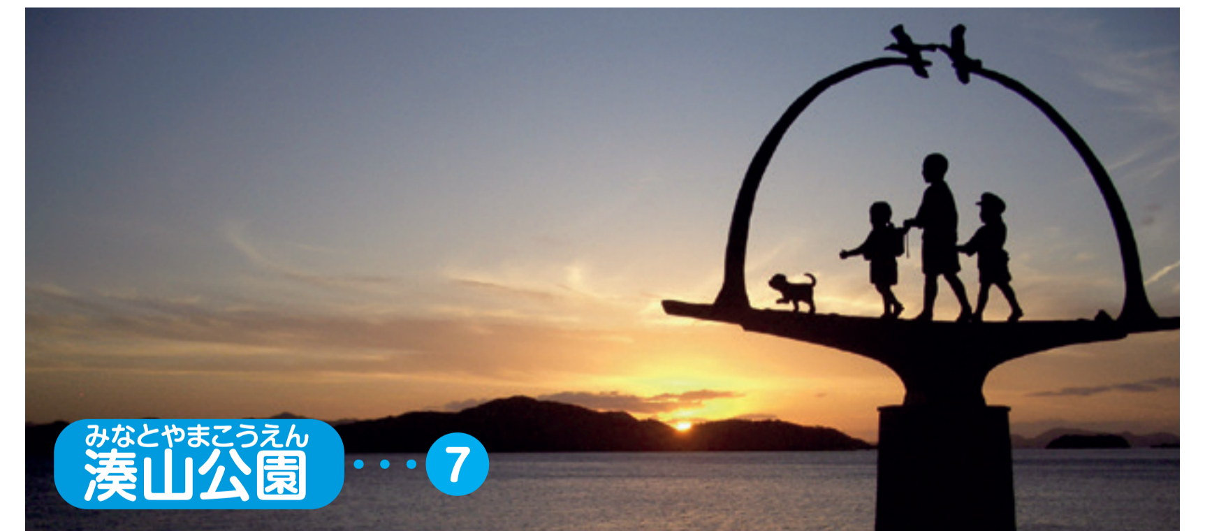
みなとやまこうえん 湊山公園 ..... 7