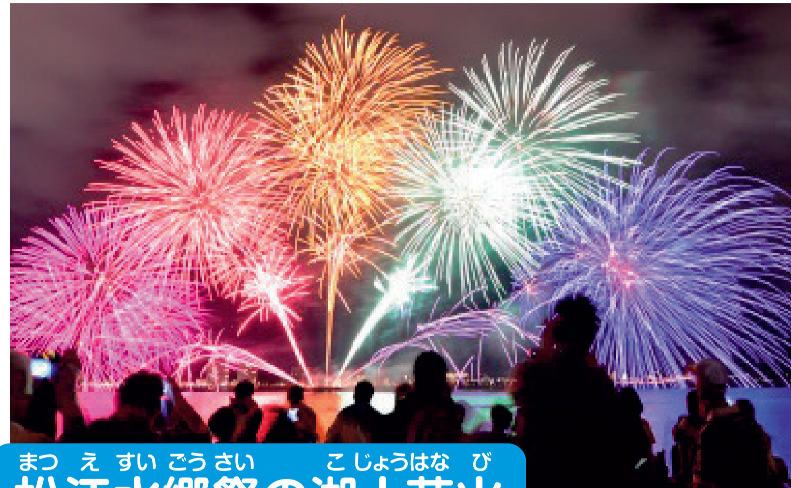
松江水郷祭の湖上花火