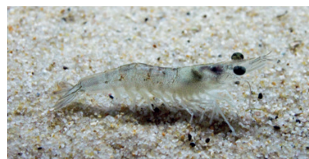
ヨシエビ(モロゲエビ)