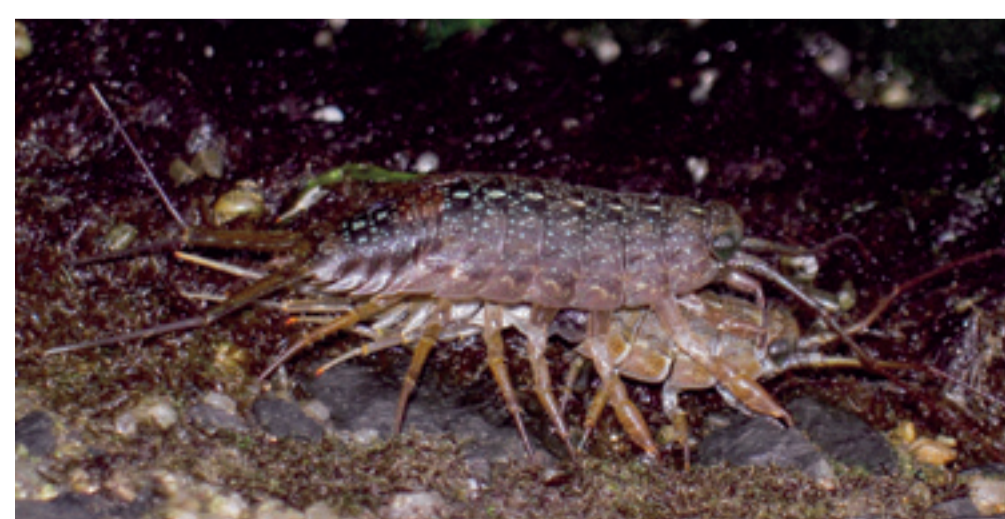
シンジコフナムシ