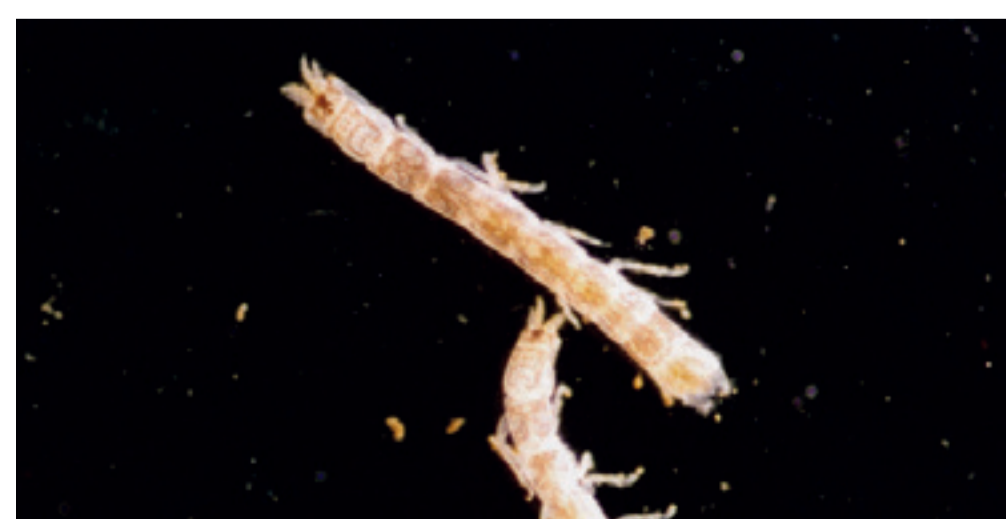
シンジコスナウミナナフシ