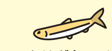
ワカサギ(アマサギ)