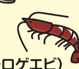
ヨシエビ(モロゲエビ)