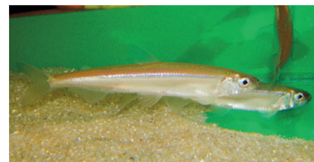
ワカサギ(アマサギ)