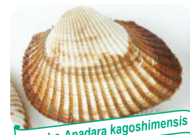
Concha Anadara kagoshimensis