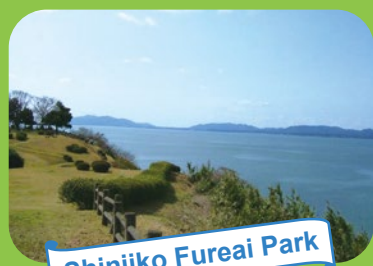
Shinjiko Fureai Park

Você pode apreciar vistas lindas de vários lugares! Pode até chegar perto d'água!