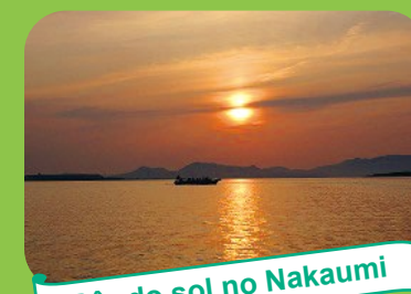
Pôr do sol no Nakaumi