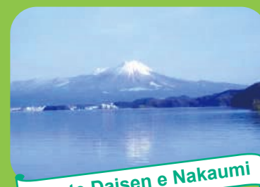
Monte Daisen e Nakaumi