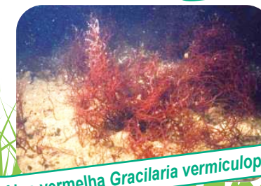
Alga vermelha Gracilaria vermiculophylla