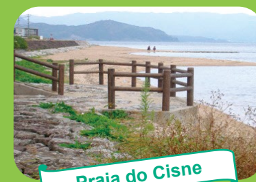
Praia do Cisne