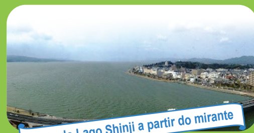
Vista do Lago Shinji a partir do mirante