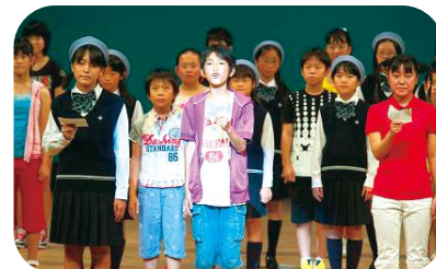
给未来的中海·宍道湖留言