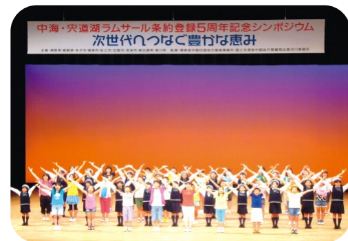
儿童环境音乐剧“爱与地球与拍卖人”