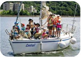
中海(韓国、香港、豊岡、滋賀)

鳥取・島根両県では、次の世代のリーダーとなる人が育ってくれることを願って、中海・宍道湖とほかの登録湿地で活動している子どもたちの交流会を続けています。