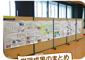
学習成果のまとめ