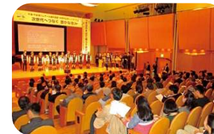
記念シンポジウム

2015年には、条約登録10周年を記念して鳥取・島根両県で記念シンポジウム(米子市)やラムサールフェア(松江市)、アジア子ども交流会を開催しました。