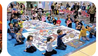
ラムサールフェア