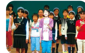
未来の中海・宍道湖へのメッセージ