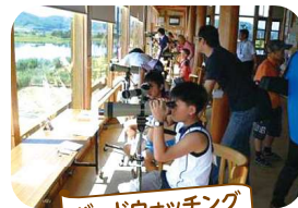
バードウォッチング