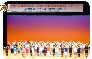
子ども環境ミュージカル「あいと地球と競売人」