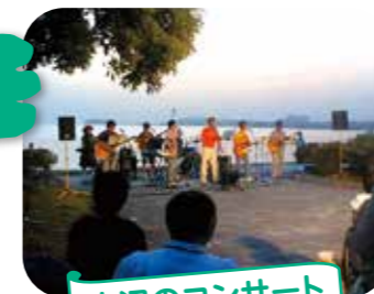
水辺のコンサート