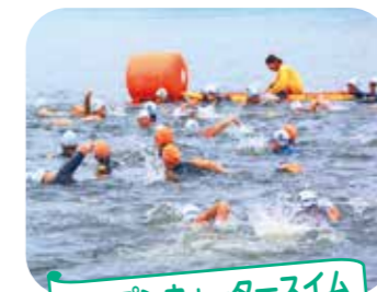
オープンウォータースイム