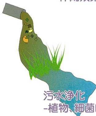
污水淨化 -植物、細菌的存在能自然處理污水-