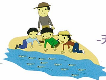
水資源 -天然的大水缸-