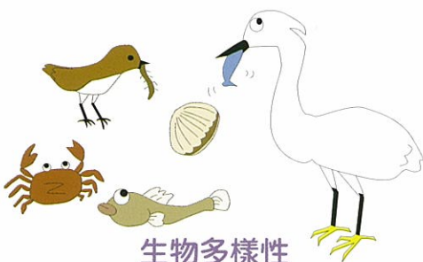
生物多樣性 -眾多生物生息之所-