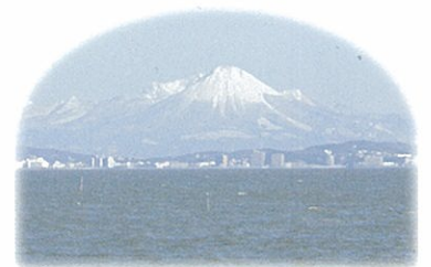
景觀旅遊資源 -自然美景-