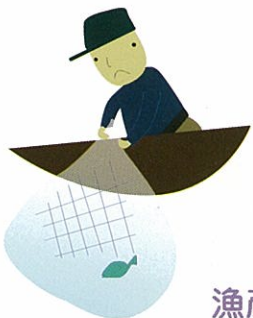
漁產資源 -美味鮮魚、貝類-

濕地的生態系統是自然界重要生態系統之一，它提供我們豐富的漁產資源、水資源、生物多樣性和景觀旅遊資源，也提供人類大自然與休閒娛樂場所。濕地的功能眾多，波及範圍不僅限于條約上已登記的濕地地區，影響範圍十分廣泛。