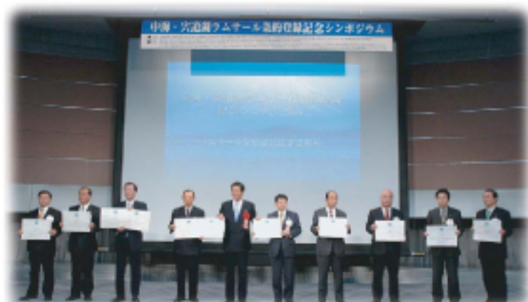
登録記念シンポジウム認定証授与式

私たちは、この二つの湖を誇りに思い、自分たちだけでなく、これから生まれてくる人たちにも、この湖の恵みを残していかなければなりません。