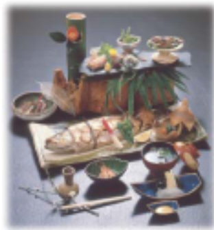
实现产品的品牌化，提高商品的价值（六道湖七珍）