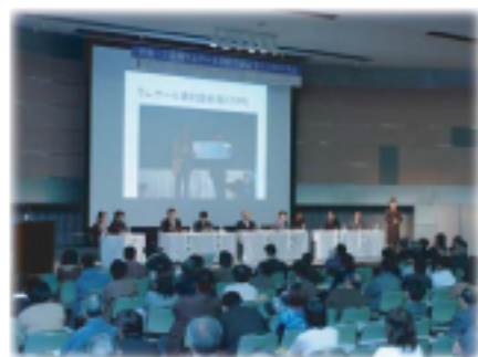
通过召开研讨会等提高大家的关心度

渔师们通过自己的努力，使今后大家也都可以吃到六道湖可口的贻贝，并一直享用这一美味。