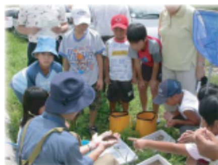
通过自然观察会等活动，更多地接触湿地生物