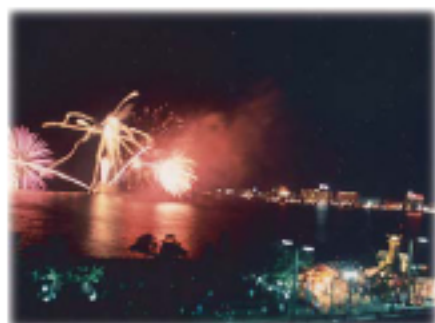
让更多的人欣赏六道湖和中海的风光（观光）