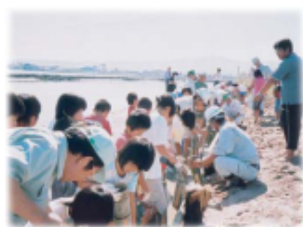
恢复湿地的自然状态