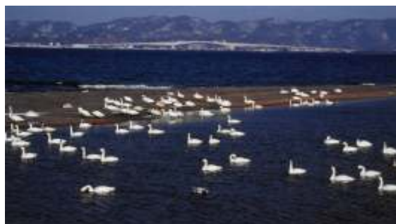
環境省 HP より