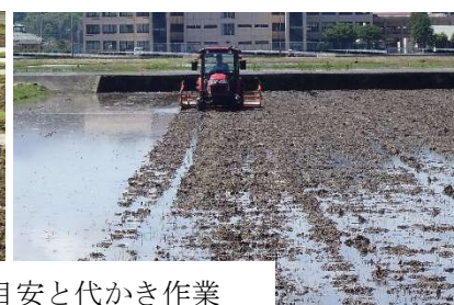
浅水代かきの目安と代かき作業