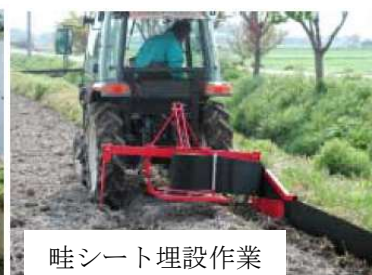
畦シート埋設作業