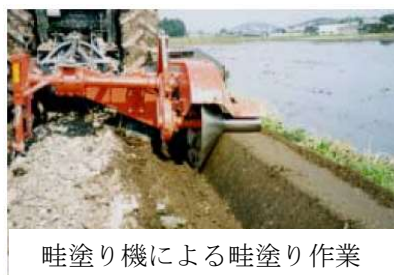
畦塗り機による畦塗り作業