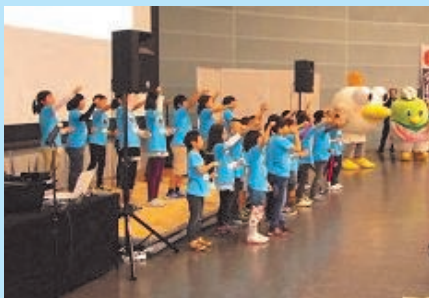
オープニングは「しじみソング」

松江市立忌部小学校の子ども達による「しじみソング」の歌と踊りでフェアがスタートし、ステージでは、中海・宍道湖の食材を使った料理実演&試食会、バルーンアートショーなど多彩な催しがありました。