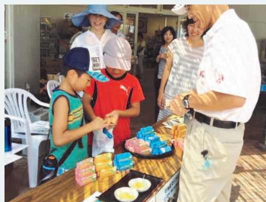
子ども達とようかんの販売

■ 認定NPO法人自然再生センター 〒690-0064 松江市天神町114 TEL (0852)21-4882 http://www.sizen-saisei.org/