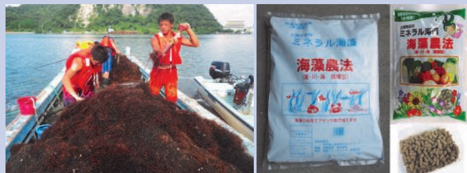
インターンシップ実習に訪れた大学生も藻刈りを体験

平成27年の2学期からは、この「安全・安心な中海の海藻肥料」で栽培された日野町産の海藻米が境港市の学校給食米に採用され、食育と環境教育の観点から高い評価を得ています。