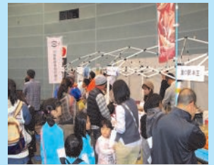
グルメブース也大賑わい

中海・宍道湖の味覚として、しじみ汁無料サービスのほか、海藻米丼ぶり、スジアオノリようかん、しじみエキス入りクレープなどの販売がありました。