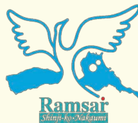
宍道湖・中海ラムサール条約シンボルマーク

1971年にイランのラムサールで開催された国際会議において「特に水鳥の生息地として国際的に重要な湿地に関する条約」が採択され、開催地にちなみ「ラムサール条約」と呼ばれます。現在、国内では釧路湿原、琵琶湖など全部で50ヶ所が登録されています。