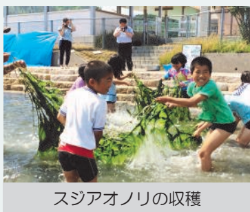
スジアオノリの収穫

また、このスジアオノリようかん、スーシーズの活動は、今年度の生物多様性アクション大賞2015で入賞しました。ようかんを通じて、子ども達の想いをのせた中海の恵みを広げる活動は、入賞した