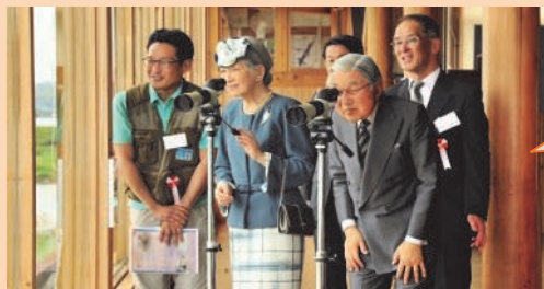
水鳥をご観察になる天皇・皇后両陛下 (平成25年5月25日)