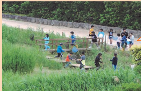
園内でメダカ採りをする子ども達