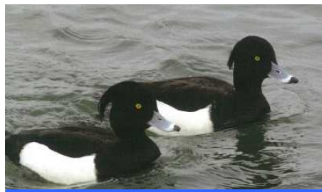
名前：キンクロハジロ