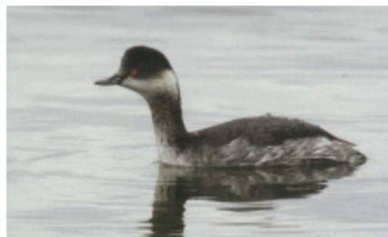
名前：ハジロカイツブリ