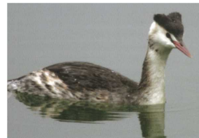
名前：カンムリカイツブリ