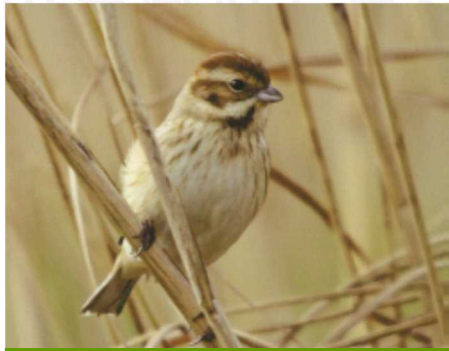
名前：オオジュリン