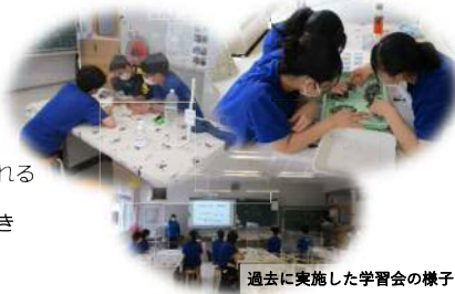
過去に実施した学習会の様子

講師：廃棄物対策課職員 時間：15分程度 ※出前講座は、事前エントリーを行い、開催を希望される団体を対象に実施します。 ※実施時期や場所については、別途調整させていただきます。