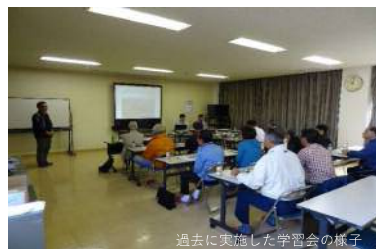
過去に実施した学習会の様子

講師：廃棄物対策課職員 時間：15分程度 ※出前講座は、事前エントリーを行い、開催を希望される団体を対象に実施します。 ※実施時期や場所については、別途調整させていただきます。