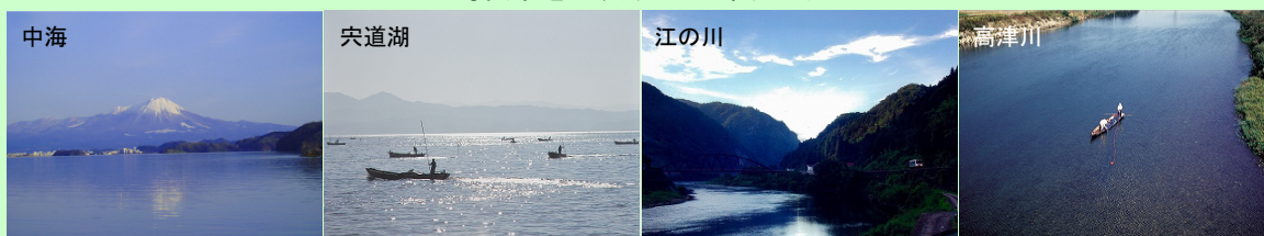
島根県を代表する水環境の例