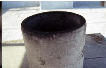
煙突の内側に使用 石綿含有断熱材