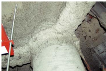
柱や梁に施工 吹付け石綿