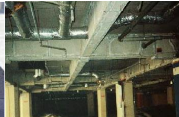
鉄骨を被覆して保護 石綿含有耐火被覆材