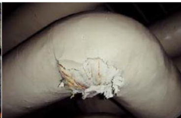
エルボ部に使用 石綿含有保温材