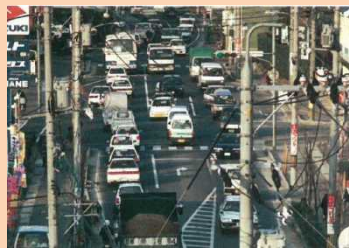
国道431号（松江市西川津町地内）混雑状況

平成5年に川津工区（3.3km）を2車線供用しました。その結果、島根大学付近の旧国道431号の交通混雑が解消されました。