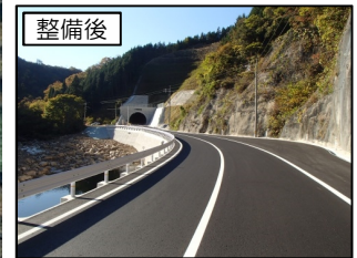
雪田トンネル（三次市側）の状況