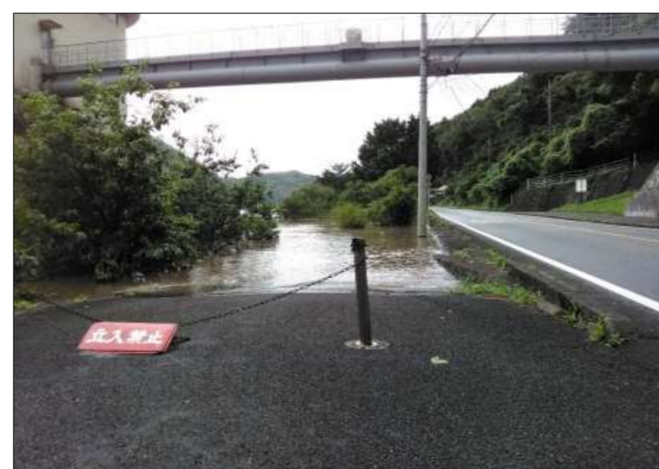
R2年7月豪雨の江の川取水場