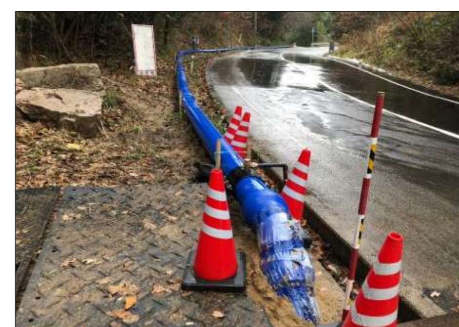
仮設送水管(斐伊川水道管路)