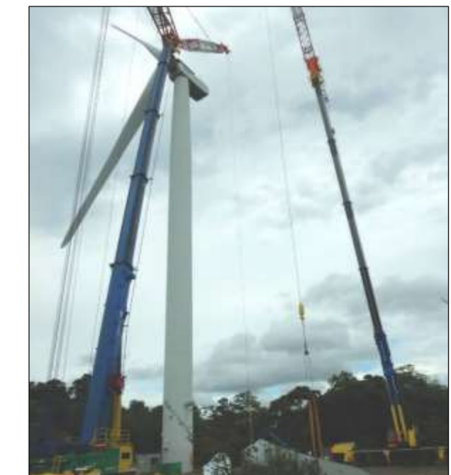
高野山風力発電所 7号機ブレード取替