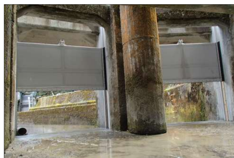
八戸川第一発電所 取水ロケット取替工事