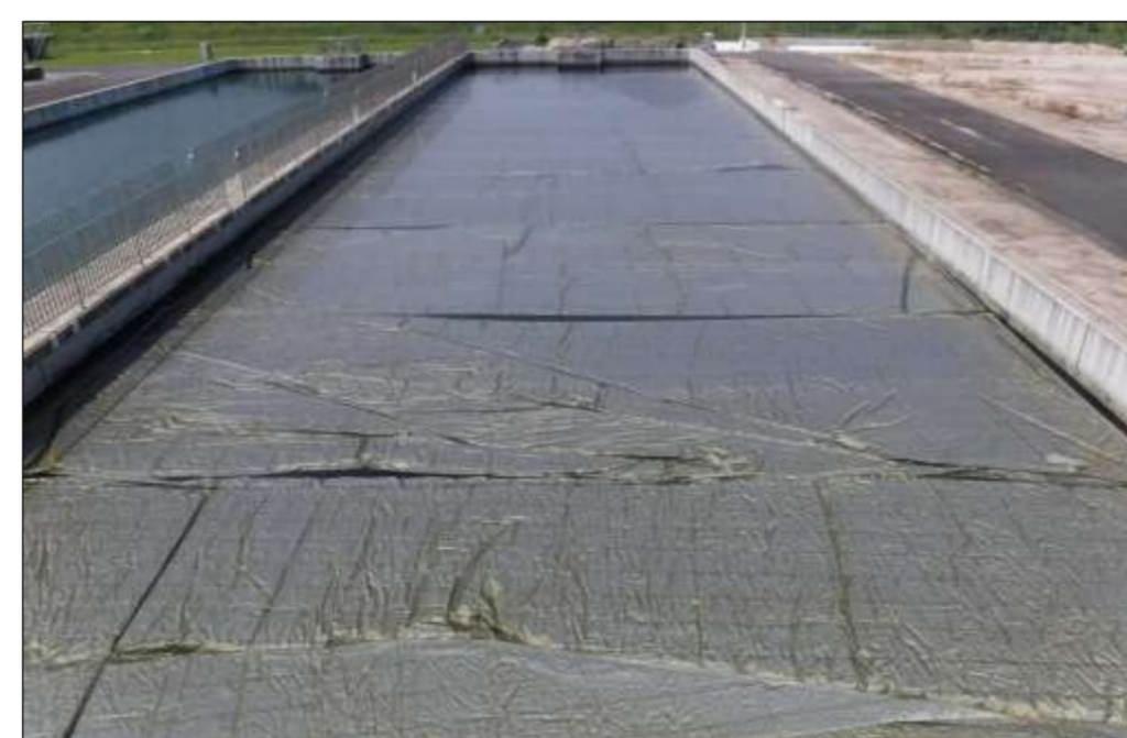
ろ過池遮光シート設置(斐伊川)