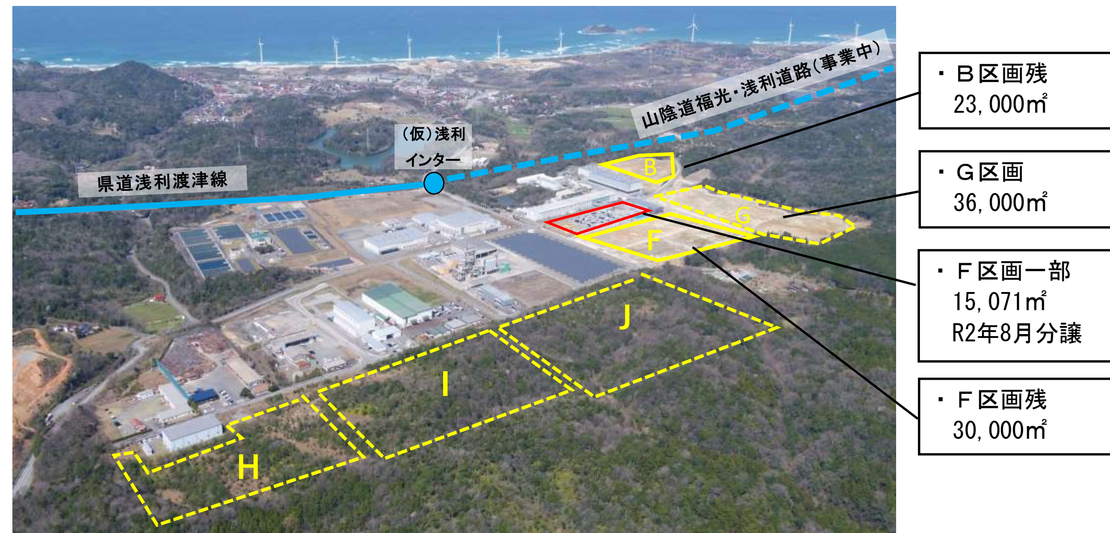
江津地域拠点工業団地