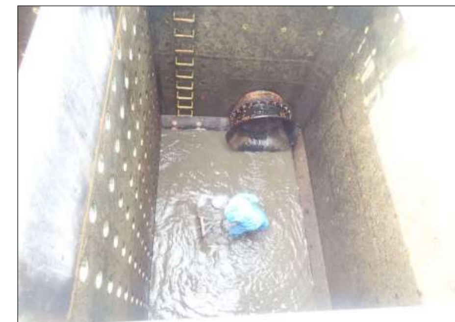
着水井清掃(江津浄水場)