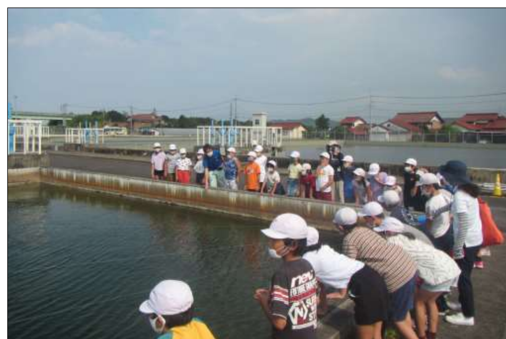
施設見学(今津浄水場緩速ろ過池)