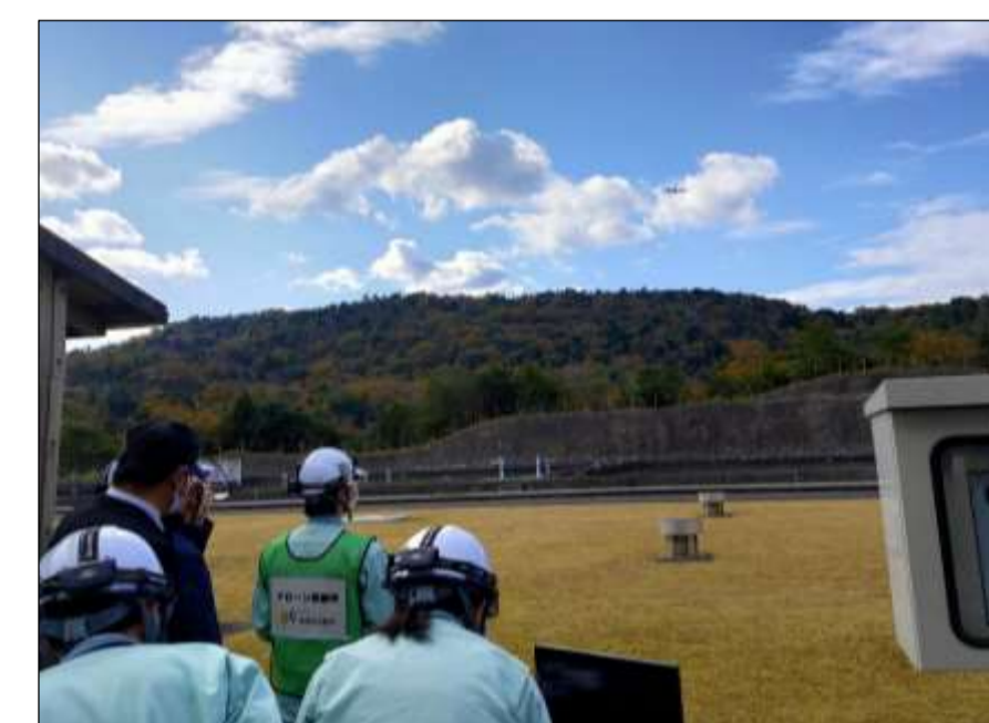
ドローン操作説明会