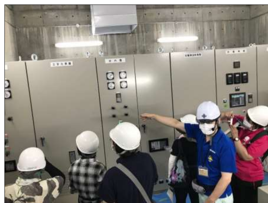
山佐発電所 完成見学会