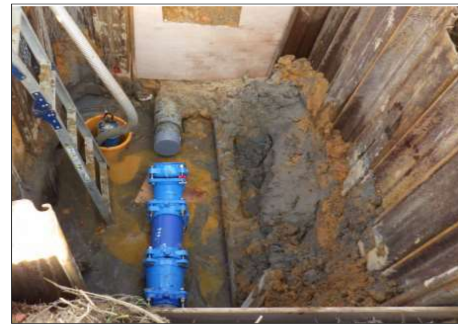
漏水修繕工事(飯梨川送水管路)