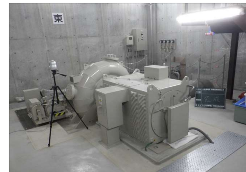
山佐発電所 営業運転開始