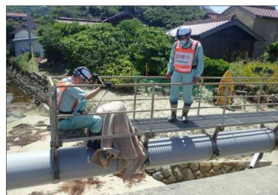
危機管理訓練2(合同訓練)