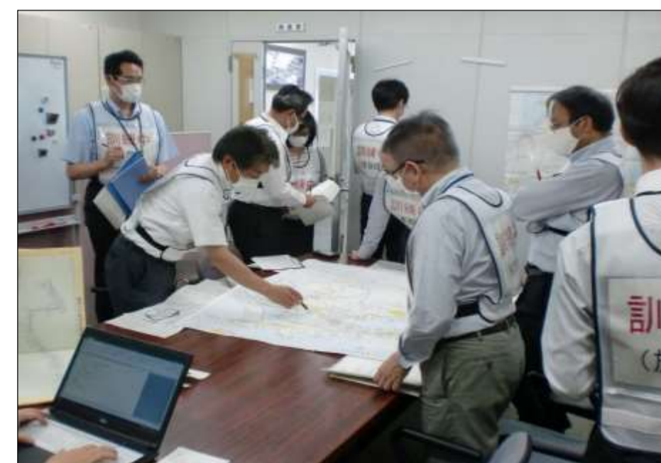
危機管理訓練1(合同訓練)