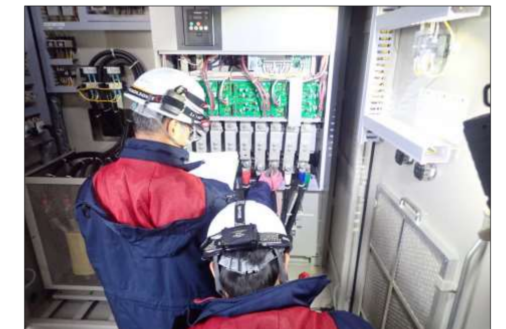
設備点検(江津浄水場)