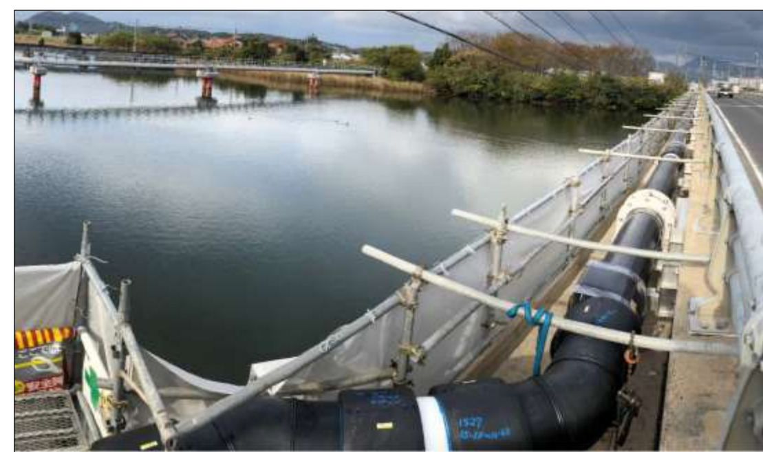
意宇川水管橋更新(橋梁添架)工事(飯梨川送水管路)