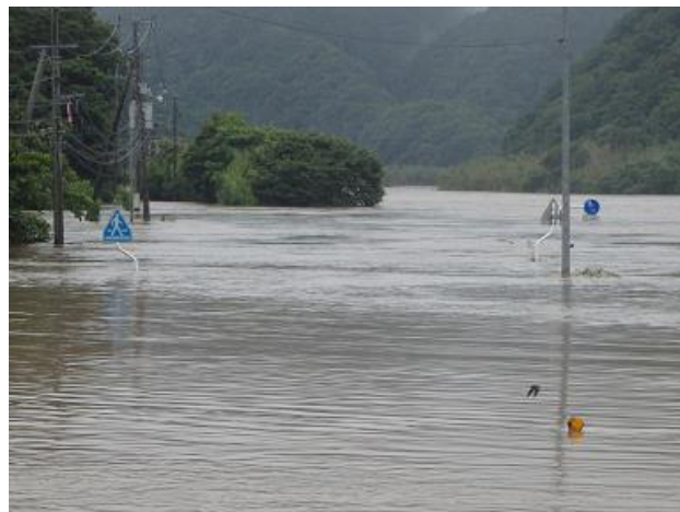
7月7日当日の江津市内江の川沿いの状況