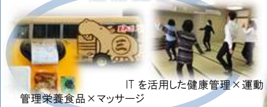
ITを活用した健康管理×運動管理栄養食品×マッサージ