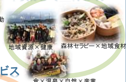
地域資源×健康 森林セラピー×地域食材