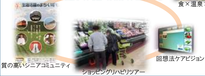
質の高いシニアコミュニティ