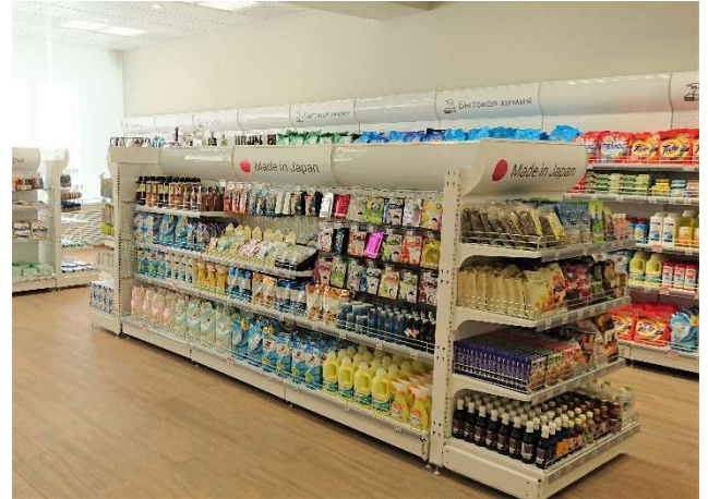
上記写真の場所に陳列し販売します。(ウラジオストク中央郵便局)

※品目によっては、ロシアポストで販売が出来ない場合がございます。また、複数の商品を希望される場合は別途相談をさせていただきます。予めご了承ください。