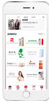
【旗艦店として常設】