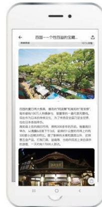
【各商品毎のページを制作】