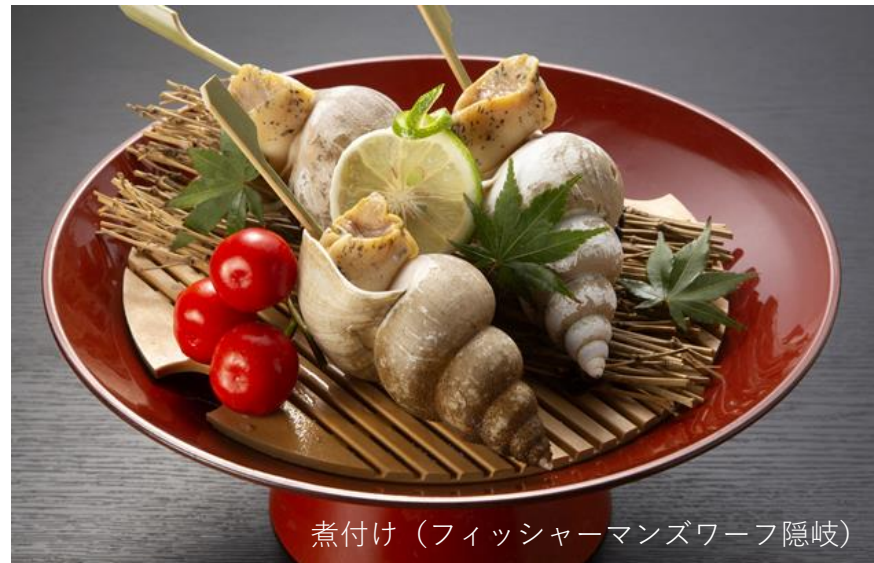
煮付け (フィッシャーマンズワーフ隠岐)