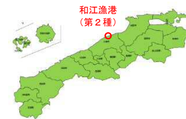
凡例（事業実施年度）