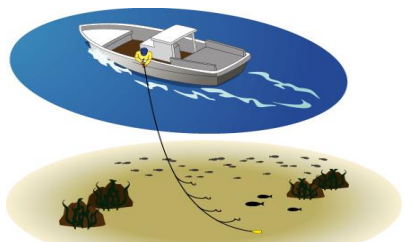
一本釣り漁業 (いっぽんづりぎょぎょう)