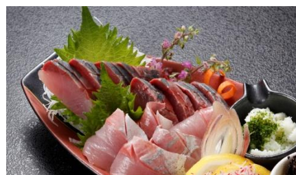
ブリの刺身(さしみ)